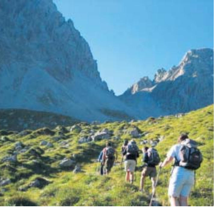
Bergwandelen in Oostenrijk.

Het aanbod van klimpaden in Oostenrijk is divers en loopt uiteen van gemakkelijke voor beginners tot en met moeilijke wanden die alleen toegankelijk zijn voor ervaren klimmers. Ook aan de jeugd is gedacht. Talrijke klimtuinen of kinderklimpaden zoals in Ramsau am Dachstein of het Oberdrautal bieden speciale kinderklimcursussen aan. De afgelopen jaren hebben de Lienzer Dolomieten zich ontwikkeld als klim-El Dorado waar speciale klimvakanties geboekt kunnen worden ( www.best-of-angebote.at/osttirol ). Het klimavontuur in het Oberdrautal is het klimpad door de Pirkner Kloof (moeilijkheidsgraad C). Waar de kloof aan het begin nog een natuurlijke speeltuin voor jong en oud is, ontpopt hij zich aan