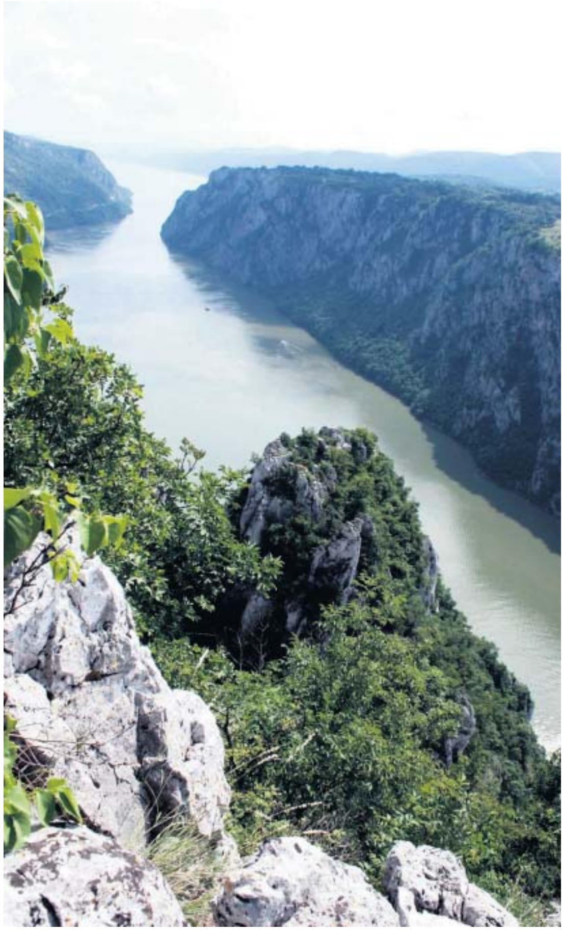
De Donau perst zich tussen de Karpaten en het Balkangebergte door.