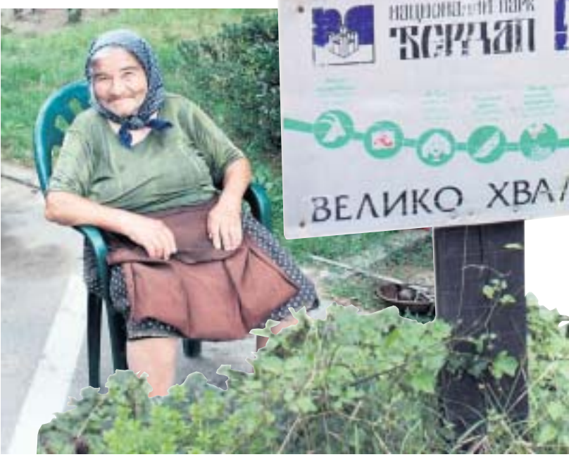
De Servische bevolking is in voor een praatje.

Nationaal Park Djerdap: bezoekerscentrum in Donji Milanovac of kijk op www.serbia.travel (ook voor info over de Tabula Traiana en Lepenski Vir) Vliegen: Amsterdam naar Belgrado rechtstreeks met Jat Airways Auto: de afstand Utrecht - Donji Milanovac is circa 1800 km. Autohuur: op de luchthaven van Belgrado: www.carrentalbelgrade.net Fietsen: er is een volledig bewegwijzerde fietsroute langs de Donau, dwars door Nationaal Park Djerdap: www.donau-info.org Overnachten: boek een kamer bij particulieren via het VVV in Donji Milanovac ( www.toom.co.yu ), kijk ter plaatse naar bordjes waarop 'sobe' (kamer) staat of overnacht in Hotel Lepenski Vir, een groot hotelcomplex uit het Tito-tijdperk.