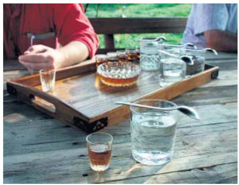
Elke maaltijd begint met een glas zelfgestookte drank.

De belangrijkste archeologische vondsten in Nationaal Park Djerdap zijn de Tabula Traiana en Lepenski Vir. De Tabula Traiana is een Romeinse gedenksteen, die omstreeks het jaar 100 v. Chr. werd geplaatst toen de Romeinse weg van Golubac naar Kladovo klaar was. De steen is alleen vanaf de Donau te zien. Ten tijde van ons bezoek voeren er geen bootjes naartoe. Lepenski Vir is een nederzetting uit 6000 v. Chr. De overblijfselen van eeuwenoude huizen, skeletten, schedels, voorwerpen gemaakt van botten en stenen sculpturen zijn lange tijd niet te bezichtigen geweest, maar sinds dit jaar heeft het publiek weer toegang tot de nederzetting.